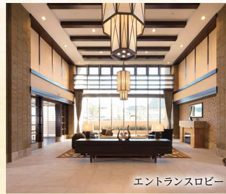
エントランスロビー

【施設概要】●施設名：ネオ・サミット茅ヶ崎 ●所在地：神奈川県茅ヶ崎市東海岸南4丁目3番3号（JR東海道線「茅ヶ崎」駅より約1,500m）●電話番号：0467-83-3310 ●開設年月日：2012年12月1日 ●施設類型：住宅型有料老人ホーム ●土地の権利形態：定期借地（契約期間 2012年3月1日～2072年2月28日） ●建物の所有者：事業主体所有 ●敷地面積：6,354.43㎡ ●延床面積：4,445.09㎡ ●建物構造・竣工日：鉄筋コンクリート造3階建・2012年10月31日 ●居住の権利形態：利用権方式 ●入居時の要件：原則入居時満65歳以上の自立の方（身の回りの事が出来る方） ●利用料の支払方式：選択方式 ●入居一時金の返還金制度の有無：有 ●居室数：60室 ●居室定員：120名 ●介護保険：介護保険在宅サービス利用可 ●共用施設：食堂（多目的ホールと共用）、ラウンジ、エントランスホール、浴室（大浴場2ヶ所）、ゲストルーム1室、談話室、娯楽室①（26.17㎡）、娯楽室②（20.15㎡）、娯楽室③（63.48㎡）、理美容室（外部サービス利用）、トランクルーム、健康相談室、共用トイレ、駐車場※下線部有料 ●入居者の状態変化に伴い、一般居室から「提携ホーム介護居室」へ住替えていただくことができます。「提携ホーム介護居室」は一般居室より占有面積が狭くなり、構造や仕様も変わりますが、それに応じた入居金の調整を行う場合があります。又住替えをした場合、居室の利用権については、一般居室の権利は消滅し、「提携ホーム介護居室」に移行します。 ●広告有効期限：2025年8月31日 ●広告作成日：2025年6月5日