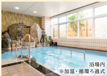
浴場内 ※加温・循環ろ過式

生き甲斐のある充実した暮らしを満喫いただけるよう、当館では季節に応じた伝統行事、芸能祭や芸術祭、日帰り旅行など、湯河原らしい時間を過ごせる多彩なイベント、アクティビティ、生涯学習などを数多く開催しています。