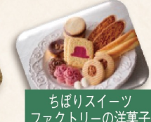
ちぼりスイーツ ファクトリーの洋菓子