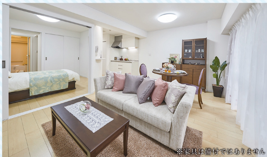
※家具は備付ではありません

【会社概要】●会社名：大和ハウ斯拉イフサポート株式会社●本社所在地：東京都港区三田三丁目1番7号三田東宝ビル6階●電話番号：03-3456-4165【施設概要】●施設名：ネオ・サミット湯河原●所在地：静岡県熱海市泉17番地の2(JR東海道線「湯河原」駅より約900m)●電話番号：0465-63-6432●開設年月日：1986年5月17日/2013年10月1日会社合併により再申請●施設類型：介護付有料老人ホーム●介護に関わる職員体制：2.5:1●土地の権利形態：事業主体所有●建物の所有者：事業主体所有●敷地面積：15,369㎡●延床面積：17,443㎡●建物構造・竣工日：鉄筋コンクリート造住宅棟5階、サービス棟4階、ケア棟3階建・1986年4月23日、2009年2月28日(ケア棟増設)●居住の権利形態：利用権方式●入居時の要件：原則入居時満65歳以上の自立の方(身の回りの事が出来る方)●利用料の支払方式：一時金方式・全額前払い●入居一時金の返還金制度の有無：有●居室数：一般185室、介護30室●居室定員：245名●介護保険：静岡県指定介護保険特定施設(一般型特定施設)第2270500669号●共用施設：食堂、浴室、健康相談室、ロビー、ゲストルーム、売店、多目的ホール、和室「寿」、カラオケ(オーディオ)ルーム、麻雀室、アトリエ、フィットネスコーナー、図書コーナー、駐車場、理美容室、ケアセンター(機能訓練室と共用)、トランクルーム、他(ケア棟：多目的ホール、談話室)※下線部有料●広告有効期限：2026年4月30日●広告作成日：2026年2月24日