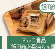
マルニ食品 「飯田商店醤油らぁ麺」 飯田商店監修