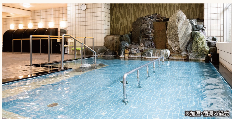
※加温・循環ろ過式

湯河原の源泉から引かれた当館自慢の温泉大浴場。泉質は弱食塩泉・弱アルカリ性で「肌にやさしい温泉」です。サラサラと肌のあたりが柔らかで、湯冷めしにくいという特徴を持っています。効能は幅広く、切り傷、打撲、外傷をはじめ、神経痛や腰痛、婦人病には特に大きな効能があります。