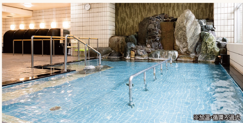
※加温・循環ろ過式

湯河原の源泉から引かれた当館自慢の温泉大浴場。泉質は弱食塩泉・弱アルカリ性で「肌にやさしい温泉」です。サラサラと肌のあたりが柔らかで、湯冷めしにくいという特徴を持っています。効能は幅広く、切り傷、打撲、外傷をはじめ、神経痛や腰痛、婦人病には特に大きな効能があります。