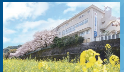
ネオ・サミット 湯河原