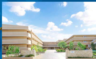
ネオ・サミット 茅ヶ崎