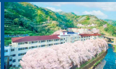
ネオ・サミット 湯河原