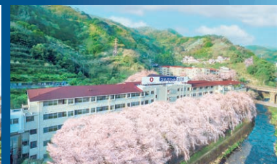
ネオ・サミット 湯河原