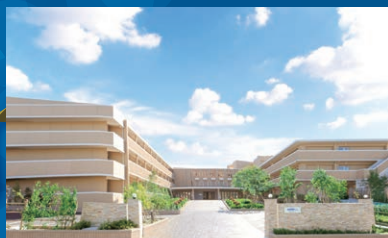
ネオ・サミット 茅ヶ崎