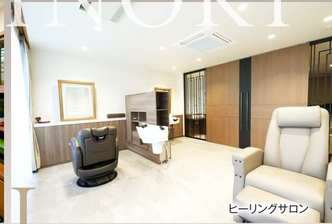
ヒーリングサロン