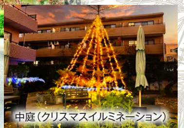
中庭(クリスマスイルミネーション)