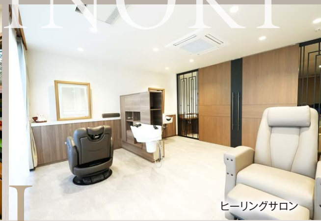
ヒーリングサロン