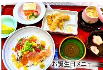
お誕生日メニュー