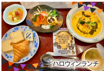
ハロウィンランチ