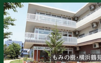
もみの樹・横浜鶴見