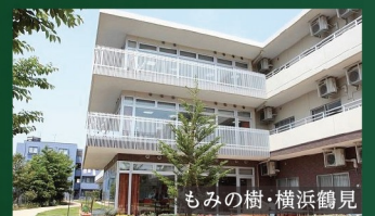
もみの樹・横浜鶴見