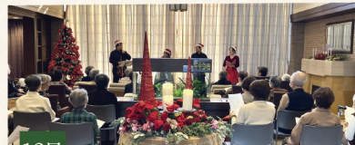
12月 クリスマスコンサート