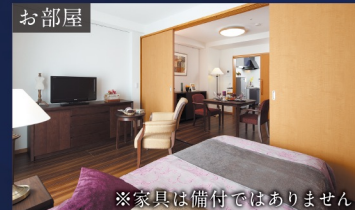
※家具は備付ではありません

常時介護が必要になった場合は、併設の介護付き有料老人ホームにお住み替えができます