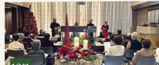
12月 クリスマスコンサート