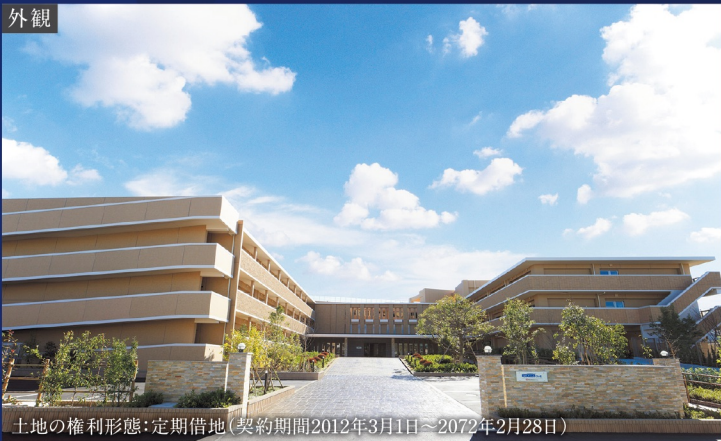
土地の権利形態:定期借地(契約期間2012年3月1日~2072年2月28日)